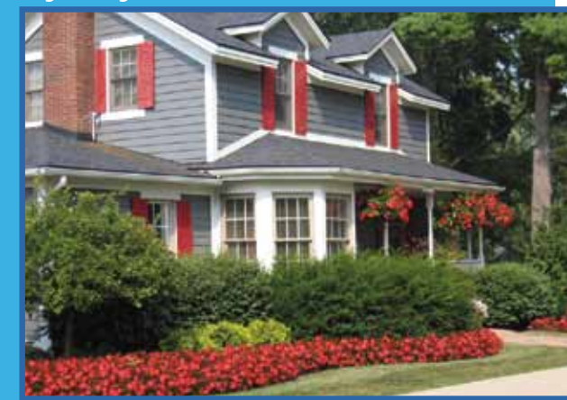
Dragon Wing Red