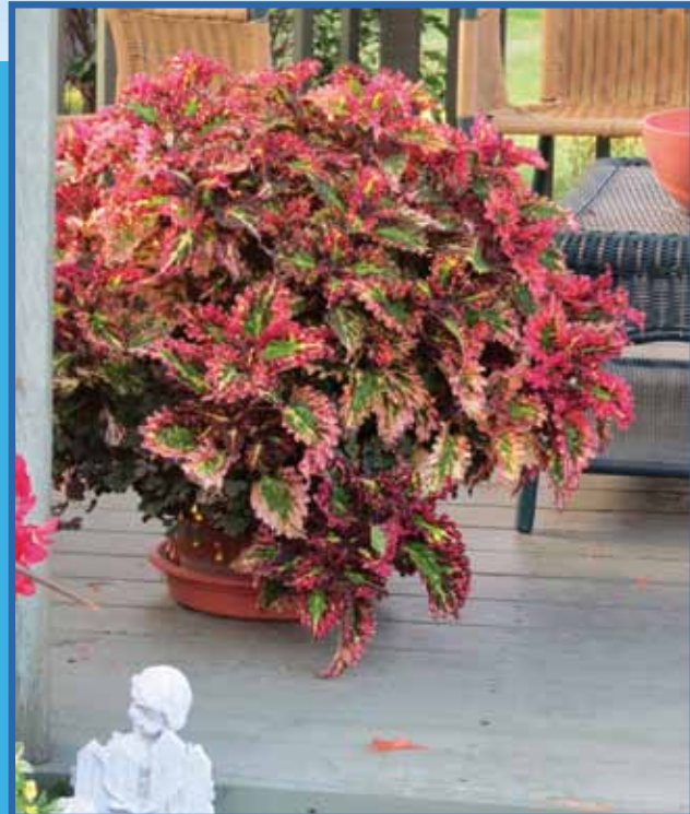
Coleus, aux coloris stupéfiants