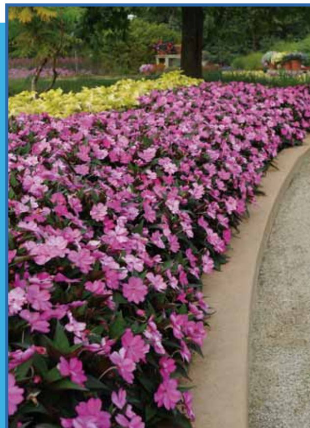
Sunpatiens: couleur lilas

Sunpatiens: couvrent 4 à 6 fois plus de superficies que les Impatiens réguliers